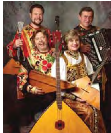
Παραδοσιακό συγκρότημα από τη Ρωσία

Αντιφωνία: εναλλαγή ανάμεσα στον κορφαίο και τη χορωδία.