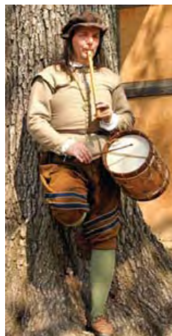
Ταυτόχρονο παίξιμο αυλού και τυμπάνου

Κάποιες φορές ο ίδιος εκτελεστής παίζει ταυτόχρονα δύο όργανα (όπως π.χ. τον αυλό και το τύμπανο στη Δυτική Ευρώπη ή το βιολί και τη φλογέρα στην Ουγγαρία).