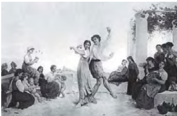
Ταραντέλα (Ιταλικός χορός)

Η οργανική συνοδεία γίνεται με συγχορδίες ή με ισοκράτημα, αφού χρησιμοποιείται μόνο για να διανθιστεί το τραγούδι.