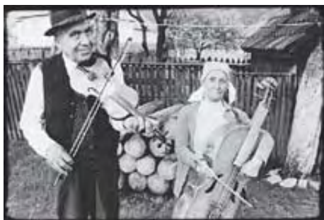
Μουσικοί από την Ουγγαρία