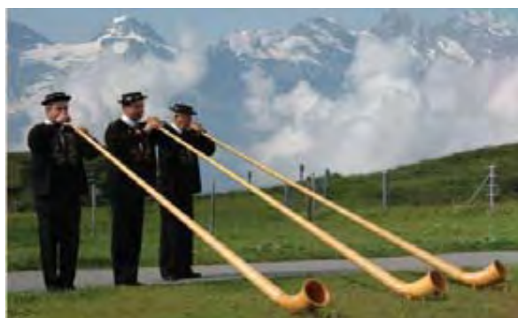
Κόρνα από τις Άλπεις